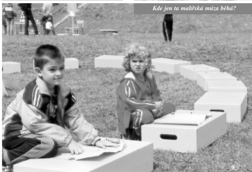
Kde jen ta malířská múza běhá?