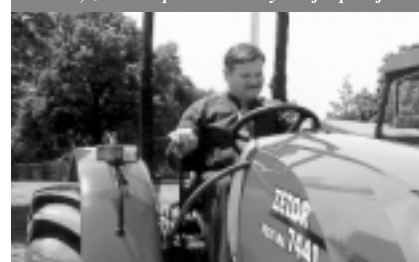
Zdá se, že i místopředseda vlády ČR je spokojen.

tom při zavedení třísměnného provozu až 18 000 traktorů ročně. Provozní zisk dosažený v roce 2004 ve výši 260 milionů korun, znamenal nárůst 225 procent oproti roku 2003. I přes výrazné „zeštíhlení“ firmy je Zetor stále jedním z největších zaměstnavatelů v regionu. Podnik sice ve svém areálu zaměstnává „jen“ cca 1100 pracovníků, ale počet pracovních míst u subdodavatelů je odhadován na 5–6000. Počet kmenových zaměstnanců by v dohledné době měl vzrůst asi o 100. Nábor pracovníků, především výrobních profesí, který má začít v červnu tohoto roku, by mohl být příležitostí i pro obyvatele Líšně. J.P.