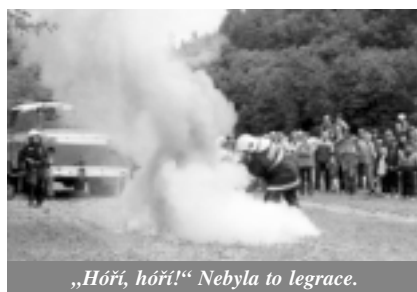
„Hóří, hóří!“ Nebyla to legrace.

N a ploše o rozloze téměř dvou fotbalových hřišť se v sobotu 11. 6. odehrávala jedna z největších akcí letošního roku – Dětský den v Mariánském údolí v Líšni. Jedno vystoupení za druhým přilákalo početné publikum ke shlédnutí výcviku psů, žonglování; svoji práci předvedli hasiči, jezdci na koních. V samostatných dílnách se malovaly obrázky, hrál se stolní fotbal. Komu to vše bylo málo, mohl se občerstvit v sousední restauraci Eldorado a vyzkoušet některou z mnoha dalších atrakcí. I přes mírnou nepřízeň počasí jsou stovky spokojených návštěvníků určitě tou největší odměnou, kterou si pořadatelé – Kulturní centrum Líšeň a restaurace Eldorado – mohly přát.