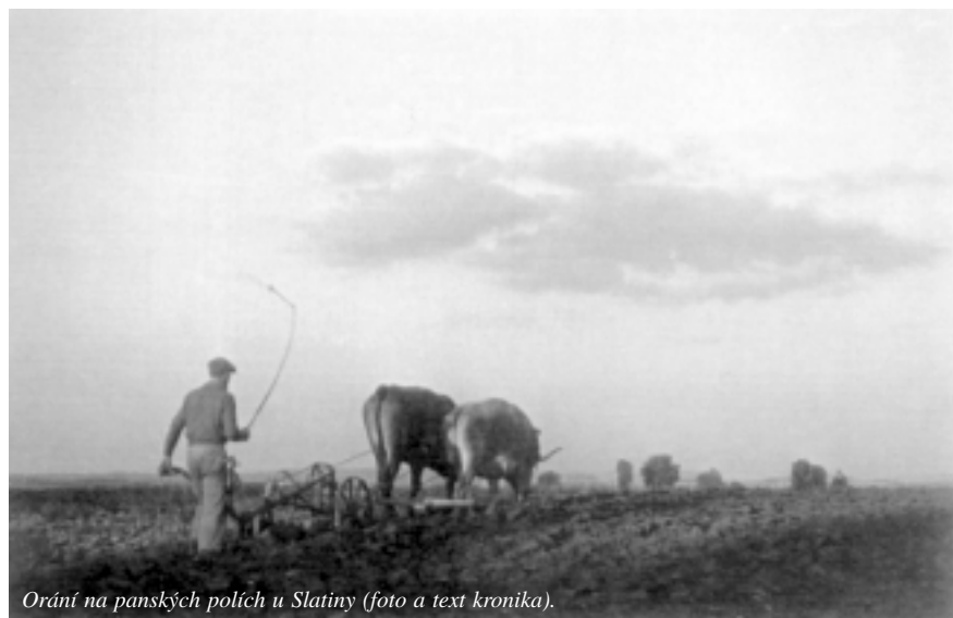
Orání na panských polích u Slatiny (foto a text kronika).

Po žních honí pastýř kozy a vepřový dobytek na strniska. Každý je rád, nechá-li mu pastýř na poli „vestát stádo“, tj. děle-li na něm pobude se stádem, neboť dobytek pole trochu pohojí. Za stara pastýř, svolávaje do stáda, troubával na dlouhou troubu, umíval „hrát na dode“ a pěkně „pískat na lopínke“. (pokračování přístě)