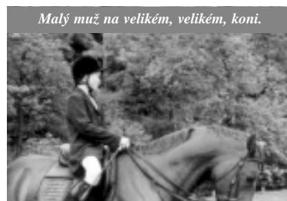
Malý muž na velkém, velkém, koni.