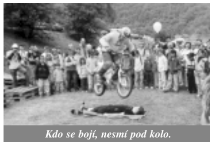
Kdo se bojí, nesmí pod kolo.