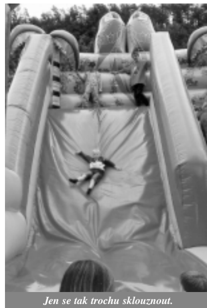
Jen se tak trochu sklouznout.

N a ploše o rozloze téměř dvou fotbalových hřišť se v sobotu 11. 6. odehrávala jedna z největších akcí letošního roku – Dětský den v Mariánském údolí v Líšni. Jedno vystoupení za druhým přilákalo početné publikum ke shlédnutí výcviku psů, žonglování; svoji práci předvedli hasiči, jezdci na koních. V samostatných dílnách se malovaly obrázky, hrál se stolní fotbal. Komu to vše bylo málo, mohl se občerstvit v sousední restauraci Eldorado a vyzkoušet některou z mnoha dalších atrakcí. I přes mírnou nepřízeň počasí jsou stovky spokojených návštěvníků určitě tou největší odměnou, kterou si pořadatelé – Kulturní centrum Líšeň a restaurace Eldorado – mohly přát.