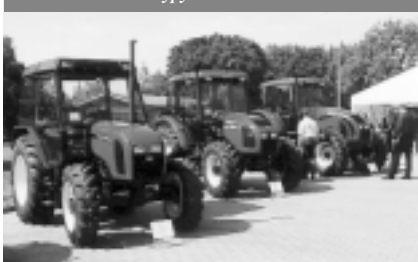
Nové typy traktorů Zetor.

cesty, jak obnovit a zvýšit prodej, ale také, jak zajistit finanční vývoj a stabilizovat zisk. Jedním z těchto postupných kroků se stal i právě dokončený projekt „Zetor new“, který byl poprvé představen v září 2004 a po devíti měsících, s investicí ve výši 75 milionů korun, úspěšně dokončen k 30. 5. 2005.