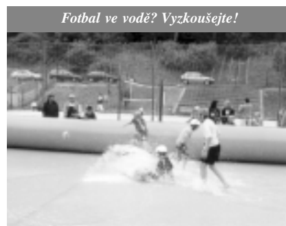
Fotbal ve vodě? Vyzkoušejte!