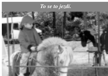
To se to jezdí.