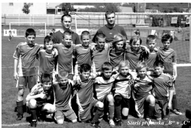
Starší příprava „B“ + „C“