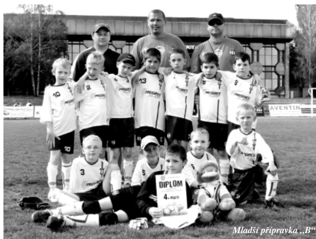
Mladší příprava „B“

Ml. příprava B (2004) – jarní část sezony začínala se stejným počtem bodů jako jejich největší soupeř Zbrojovka. I když jim občas nevyšel začátek zápasu a soupeř šel do situací bojovným výkonem, několikrát se jim podařilo zápas otočit a zvítězit a vybojovat si tak konečně 1. místo (1 bod před jejich rivalem). V soutěži odehráli celkem 16 zápasů, z nich vzešlo 13 výher, 2 remízy a 1 prohra. Nejlep-