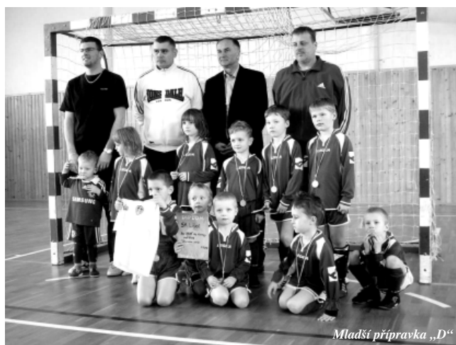
Mladší příprava „D“

Ml. příprava D (2006) – nehrající. V současné době je tým tvořen dvanácti chlapci r. 2006 a jednou dívkou r. 2005. Na jaro 2012 se mladší příprava „D“ zúčastnila 6-ti turnajů hráčů ročníku 2006 (2x na Slovensku) a dvou interních turnajů klubu SK Líšeň. V rámci těchto turnajů změřili síly např. s družstvem Spartaku Trnava, nebo Bohemians Praha. Mimo to sehráli řadu přátelských utkání s brněnskými kluby, zejména se Zbrojovkou a i tato utkání ukázala, že nám v Líšni roste velmi silný ročník. Důkazem toho je i skutečnost, že ti nejlepší z dětí nastupovali na několika turnajích i za ml.