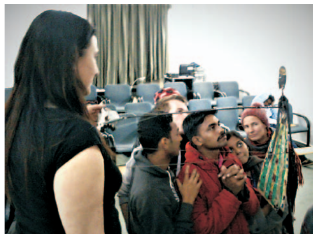
Členové indického souboru Tolpava Koothu zkoumají mechanismus loutky Sávitří divadla Líšeň.