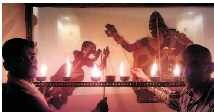
Technický ředitel divadla Líšeň s tradiční indickou loutkou souboru Tolpava Koothu.

souzněla s vizí festivalu – experimentální, moderní formou zpracovaný tisíce let starý příběh z Mahábháraty. Inscenaci jsme odehráli v angličtině a po představení jsme se těšili upřímnému nadšení publika i odbornému zájmu kolegů z ostatních souborů. Ovšem nejdůležitější prozkoumávali naši pohyblivou, hlavou kývající a otočnou loutku Indové ze souboru Tholpava Koothu. Jejich zájem i ocenění jsme si velmi považovali, protože kdo jiný by naše pojetí prastarého indického eposu mohl zhodnotit lépe, než členové starobylého rodu Pulvarů uchováající – ho tradici stínového obřadu již po dvanáct generací. Ti nám také posléze připravili jedinečný zážitek, který se poštěstí jednou za život – byli jsme svědky jejich hry Ramayana uváděné v záři i dýmu lamp naplněných kokosovým olejem, za zpěvu a zvuku bubnů, hrané starobylými loutkami z kůže, ručně vytepanými do neuvěřitelného ornamentálního detailu. Na festival