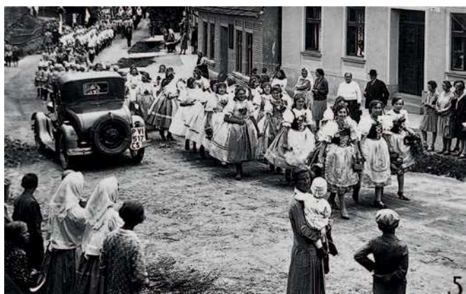
Ulice Šimáčkova – fotografie archivu Líšeň, dárce neznámý, předpoklad – před rokem 1938, kdy ulice nesla jméno Jiráskova