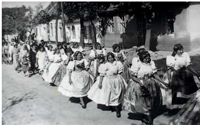
Ulice Šimáčkova – fotografii poskytla rodina Švehlova, předpoklad – před rokem 1938, kdy ulice nesla jméno Jiráskova